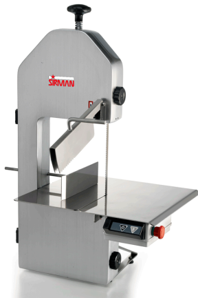
Sirman Пилы для резки мяса , model SO 1840 F3 :

Sirman Spa Viale dell'Industria 9/11 35010 PIEVE DI CURTAROLO (PD), Italy Tel./Fax. +39 049 9698666 / +39 049 9698688 email: info@sirman.com