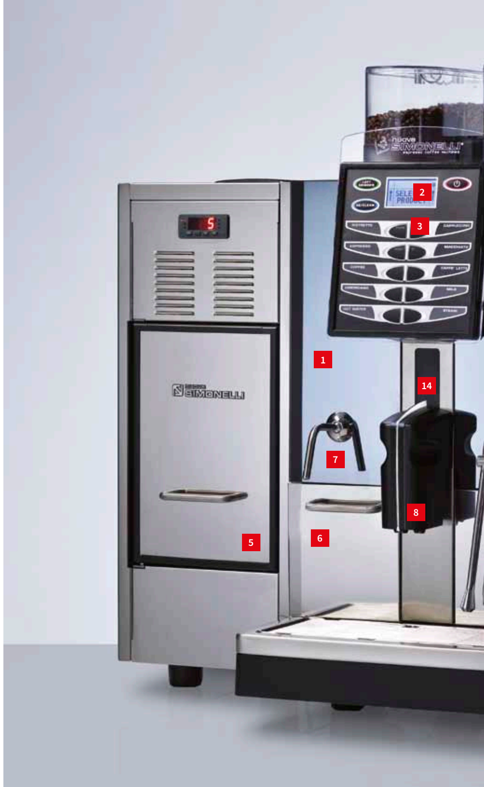
6 Ampio cassetto fondi Large coffee ground container