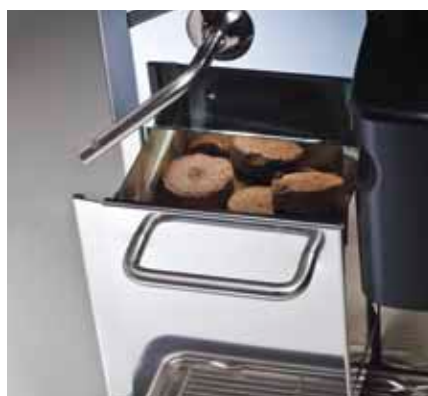
6 Ampio cassetto fondi Large coffee ground container