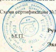
Схема сертификации №3а. Инспекционный контроль за сертифицированной продукцией-1 раз в год