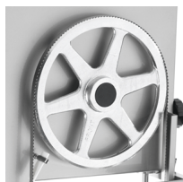
Hermetic upper pulley