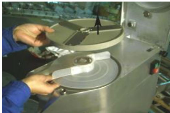
Установка режущей пластины (4)