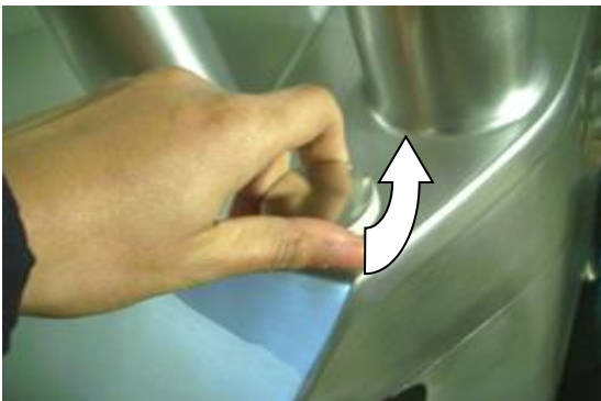
Открывание крышки (3)