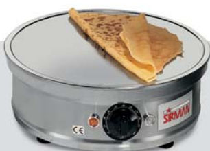
CREPIERA TONDA CON INCAVO