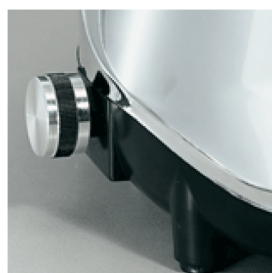
Variable speed device optional