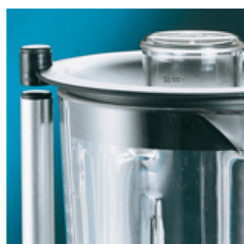
Microswitch on cover