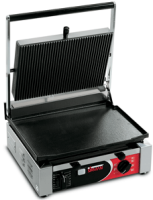
CORT L Timer

- Механический таймер, не входящий в комплект.