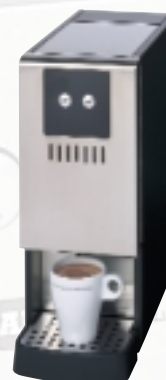
Аппарат для приготовления горячего шоколада «Chocolino»