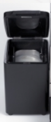
Холодильник для молока объёмом 2 литра