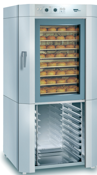
EUROMAT B8 EM