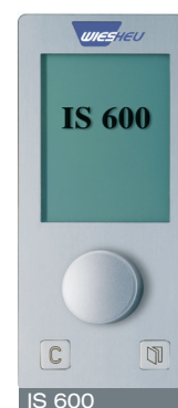
IS 600 Только для Euromat B15