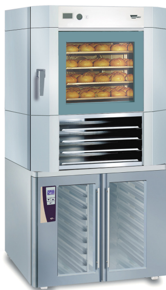
EUROMAT B4 EM