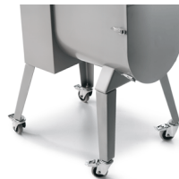
Optional legs with wheels